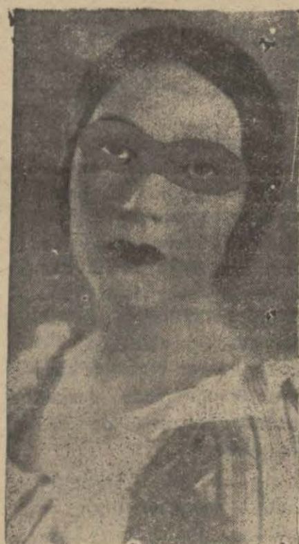
olduklarını bulup çıkararak "SON POSTA" sinema müsabak memurluğuna, bildirenler arasında bir kur'a çekilecektir. Bu kur'anın cevapları müsabaka bittikten sonra muayyen