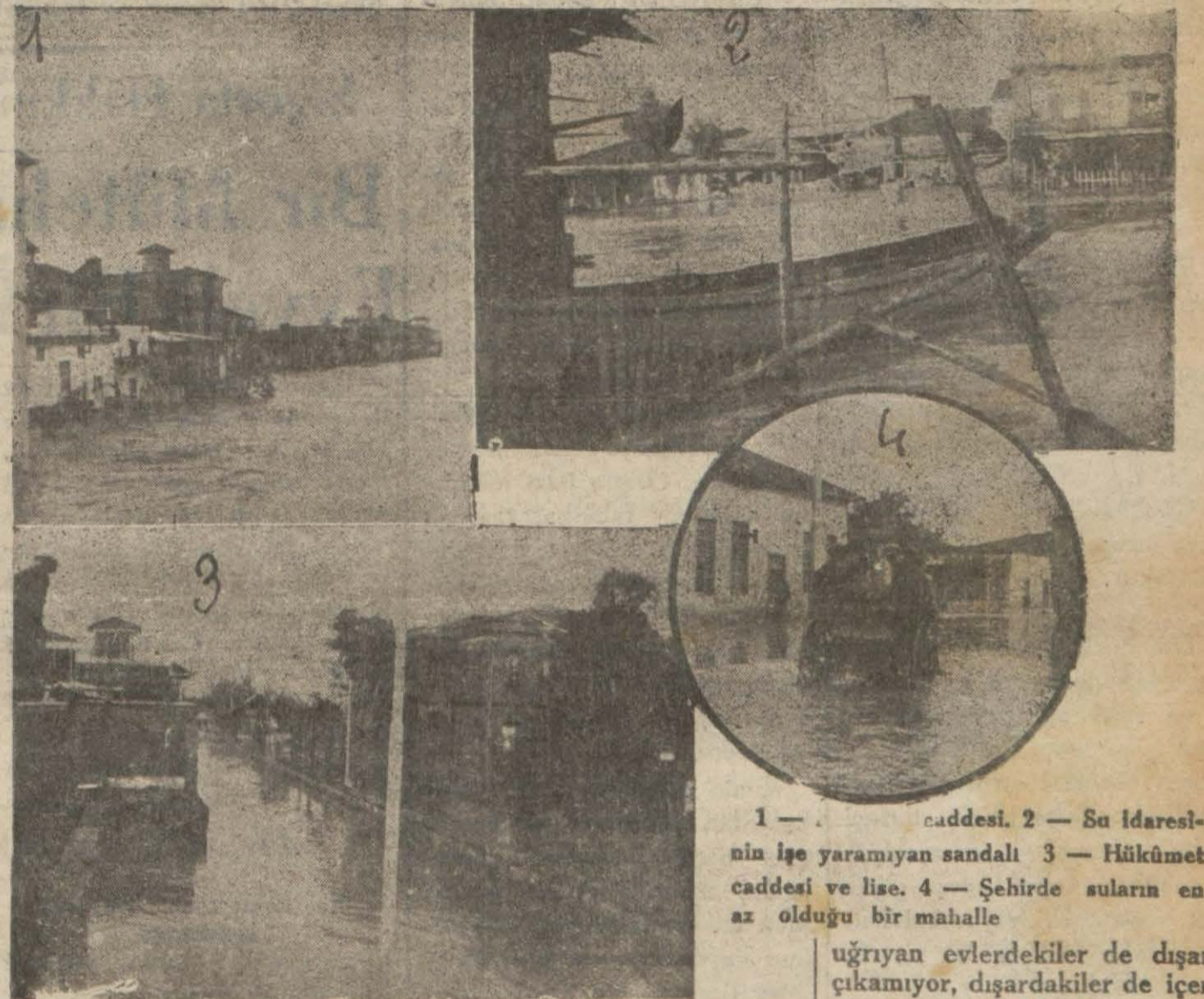
1 — caddesi. 2 — Su idaresi- nin işe yaramıyan sandalı 3 — Hükümet caddesi ve lise. 4 — Şehirde suların en az olduğu bir mahalle

Birinci Ve İkinci Su Baskınları Nasıl Oldu, Boğulanların Adedi Ve Zararın Miktarı Ne Kadardır?