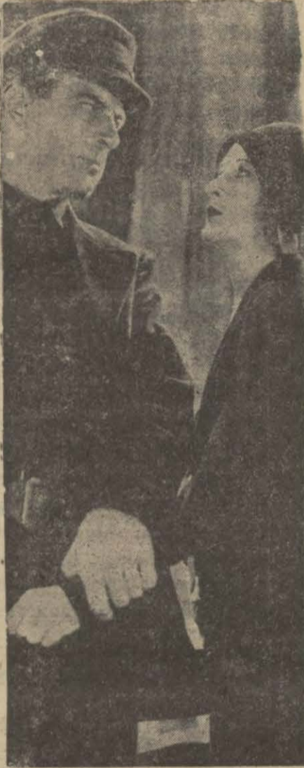
sürüklüyor ve o gündenberi mütemadiyen