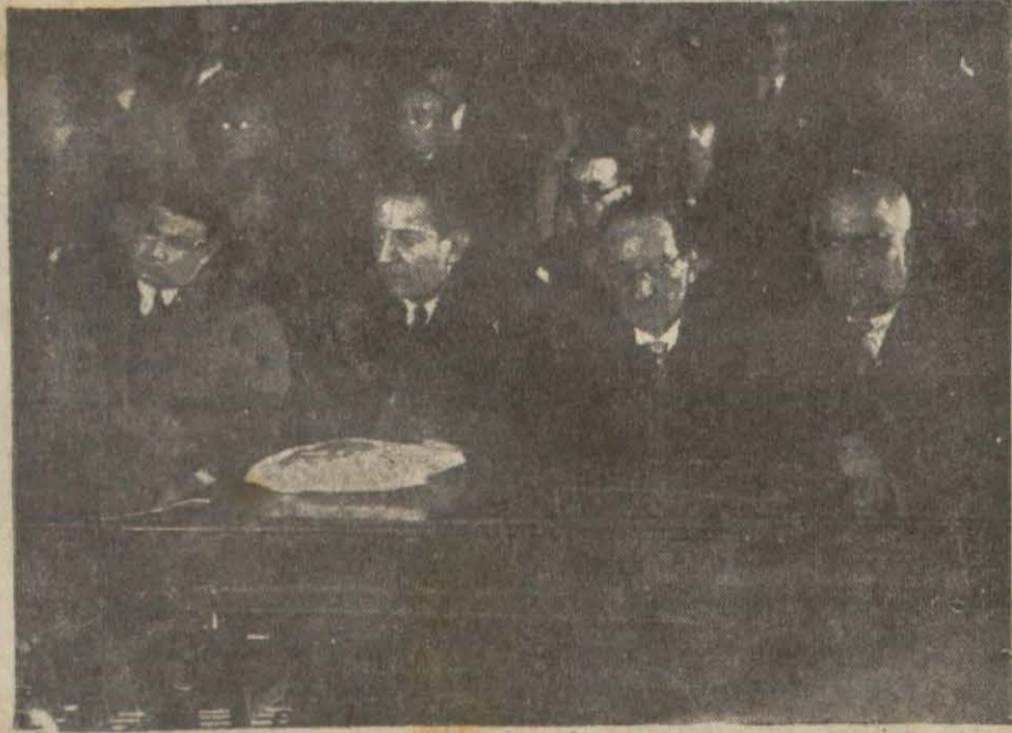
Vaktile bu meseleden dolayı gazeteciler Üçüncü ceza huzurunda mahakeme edilmişlerdi

Barut İrtişa meselesi yeni- den ortaya çıktı. Bir vakitler birdenbire alevlenen, İstanbul matbuatını mahkemeye sürük- liyen bu dava âni olarak neden derin bir uykuya daldı? Bütün efkârı umumiye de mu- amma halinde kalan ve bir türü cevabı bulunamıyan bu suali dün İzmir gazetesinden naklen Mahmut Esat Baye sorduk.