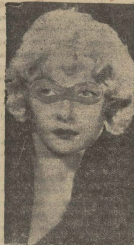
bir müddet zarfında gönderilmek lâzımdır. Bu müddeti ayrıca ilân edeceğimiz gibi taşra karilerimizin de iştiraklerini temin etmek için arada kâfi zaman bırakacağız. Birinciliği kazanana maruf bir